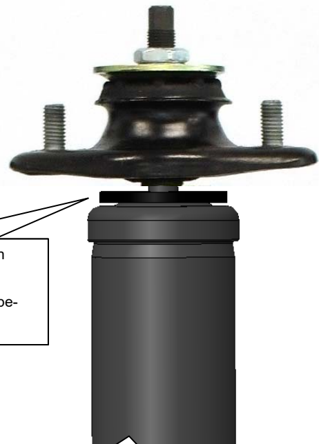
Nicht einstellbarer Dämpfer Non-adjustable dampers

Mitgelieferte Stützscheibe muss zwingen unterhalb dem Stützlager montiert sein! The supplied washer must be mounted below the top mount!